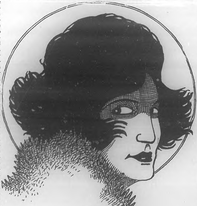
H. Portell Vila

Napoleón llamó "dije" a la mujer bonita.