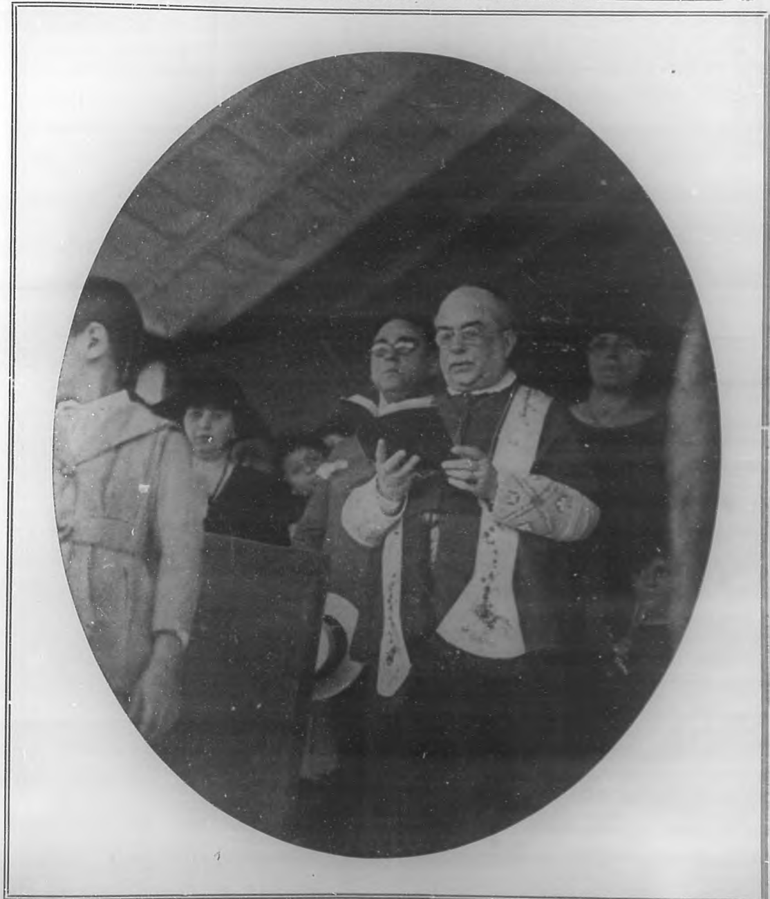
Momento en que el Ilmo. y Rvdo. Obispo de la Habana, Monseñor Estrada, bendecía la bandera de los Exploradores de Cuba, (Boy-Scouts), durante la fiesta celebrada el domingo, con dicho motivo, en la Batería número 3. Dicha bandera fue donada a la institución por el Sr. Miguel Tarafa.

Redacción, Administración y Talleres: Edificio de BOHEMIA, Trocadero número 89, 91 y 93.— Teléfonos: Dirección, 110-112; Administración, 110-112; Redacción, 110-112.