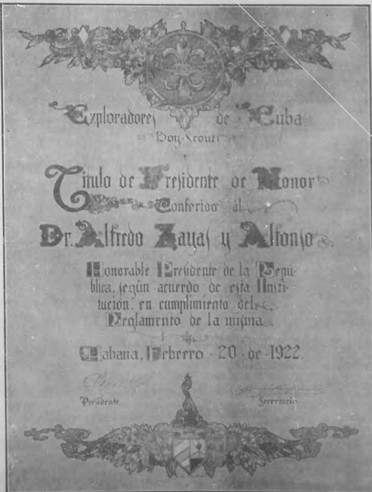
Facsímil del bello diploma ofrecido por los Exploradores al Honorable Presidente de la República y que ha sido obra del notable dibujante Pedro A. Vaz.

La bandera es el símbolo de la Patria. Vuela hoy, como ondea majestuosamente. En lo alto de las fortalezas, en