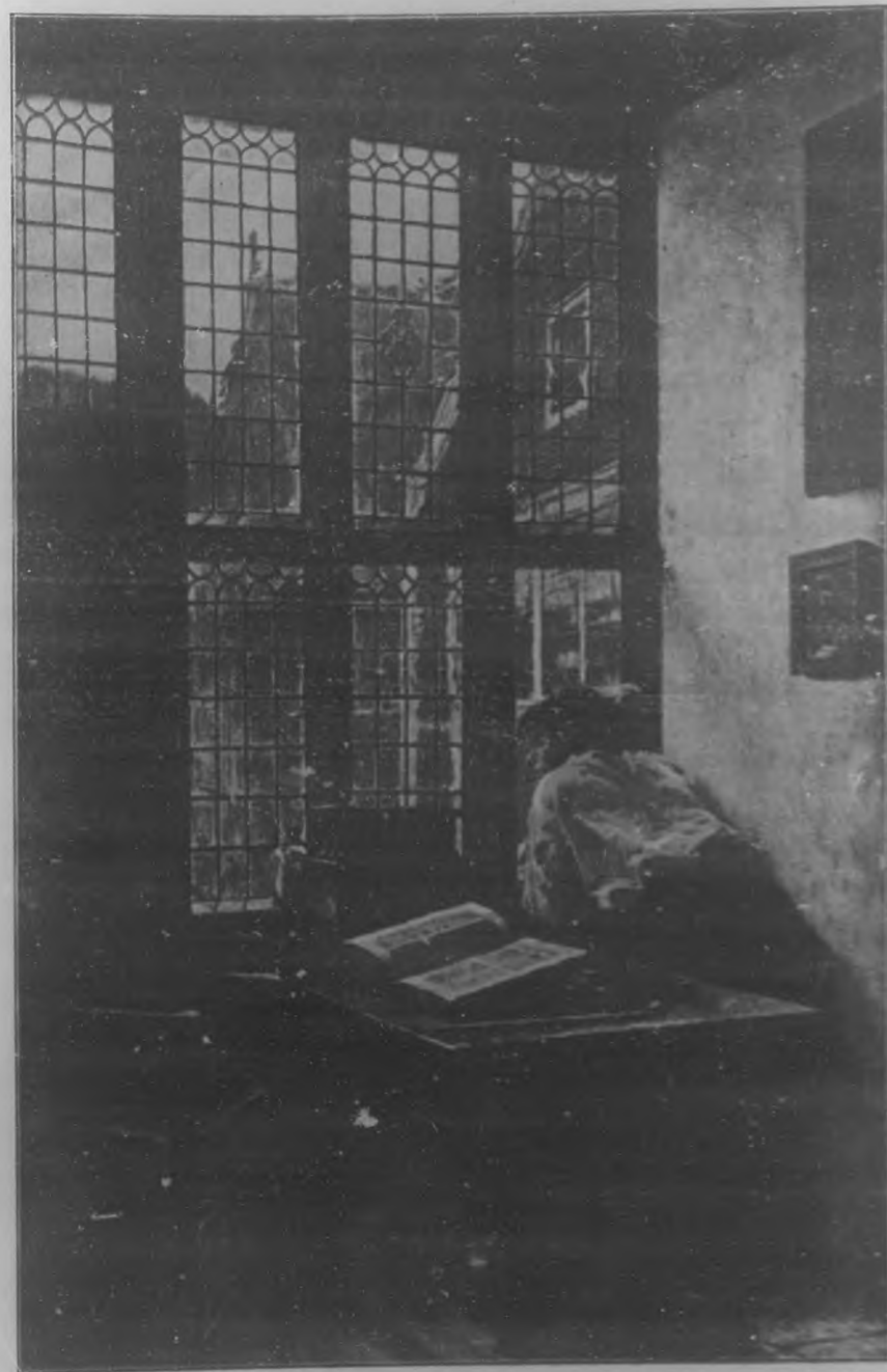
LECTURA INTERRUMPIDA Cuadro por Claus Meyer.