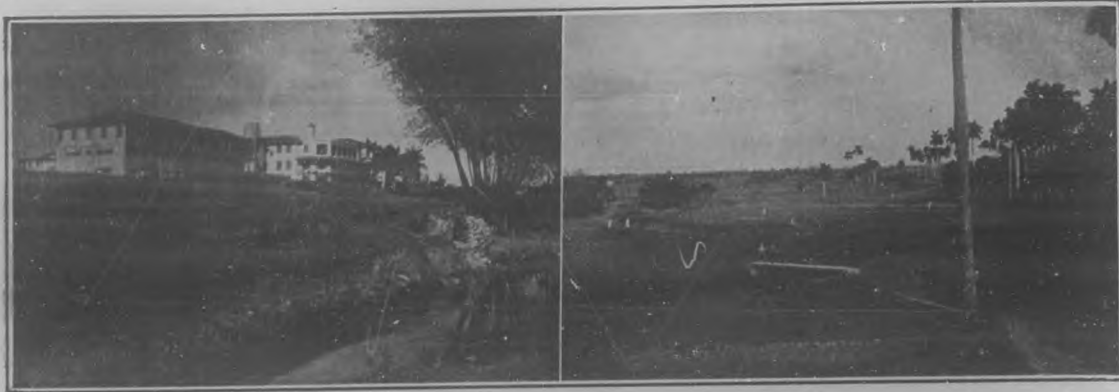
A la izquierda: Casa y terrenos del "Country Club" de la Habana, con el pintoresco río que corre por parte de sus "links".—A la derecha: Un hermoso aspecto de los campos de "golf" del "Country Club". Los jugadores se ven diseminados a grandes distancias.

EL TEAM DE LA CIUDAD DE MIAMI FUE VENCIDO POR CONTRERAS-ZALDO.