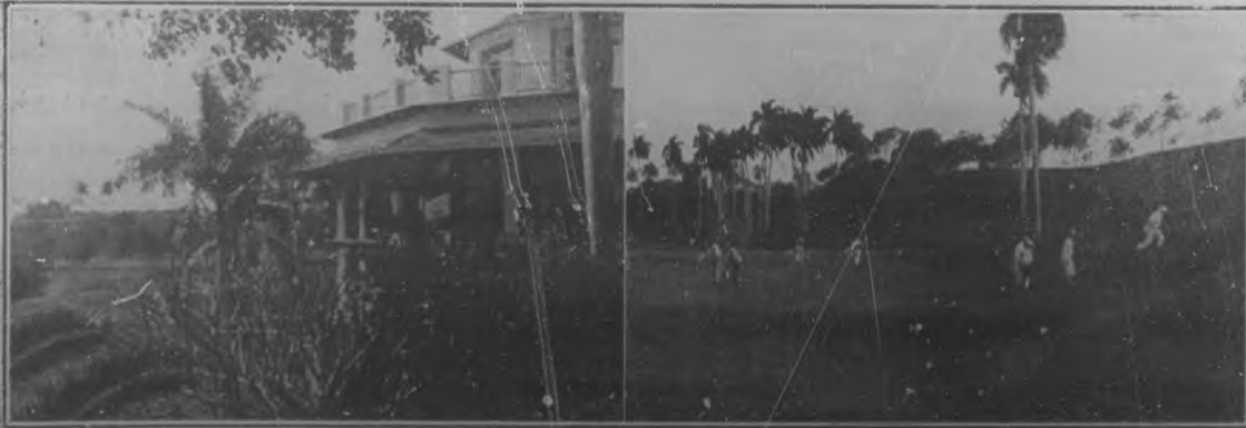
A la izquierda: Bellísimo ángulo de los jardines y edificios del "Country Club". Un aspecto encantador que por primera vez ha reproducido la lente. A la derecha: Instantes en que los players salvan un "hazard", en el último Campeonato Nacional de Amateurs, celebrado el pasado febrero en la pista de "golf" del "Country Club".